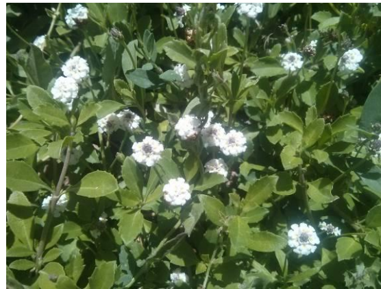
Phyla nodiflora L.

(Ribulose 1,5-bisphosphate) و کاهش فعالیت روپیسکو و یا هر دو ظرفیت فتوسنتزی را کاهش می‌دهد (Parida & Das 2005). جلوگیری از رشد همراه با بسته شدن روزنه‌ها جزء اولین پاسخ‌های گیاهان به خشکی است (Pessarakli 2007). مکانیزم فتوسنتزی در کلروپلاستها عمدتاً پیچیده است و در طی مراحل اولیه خشکی محدودیت عمده در فتوسنتز ناشی از بسته شدن روزنه‌ها