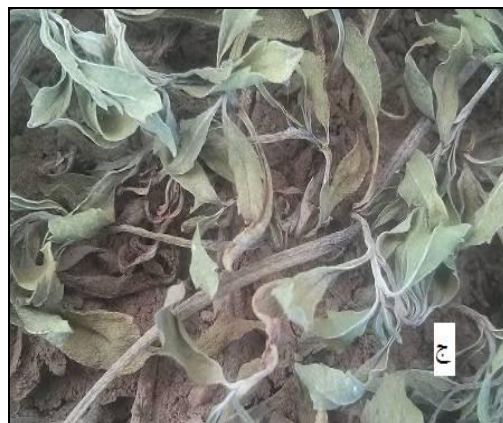
شکل ۲- دو گیاه پوششی مورد مطالعه بعد از اعمال تنش شوری الف "فیلا" و ب "فرانکنیا"، بعد از اعمال تنش خشکی ج "فیلا" و د "فرانکنیا"

طول شاخساره در فرانکنیا در اثر تیمارهای به کار رفته به طور معنی‌داری نسبت به فیلا کاهش نشان داد. نتایج برهمکنش سطوح آبیاری و سطوح شوری نشان داد که بیش‌ترین طول شاخساره مربوط به فیلا و تیمار ۱۰۰٪ ظرفیت مزرعه و شوری ۰/۵ دسی‌زیمنس بر متر و کم‌ترین آن مربوط به فرانکنیا در ۵۰٪ ظرفیت مزرعه و ۹ دسی‌زیمنس بر متر می‌باشد (جدول ۱).