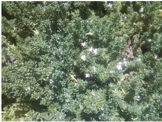
Frankenia thymifolia Desf

می‌باشد (Fu et al. 2001). نقصان در فتوسنتز خالص در اثر تنش خشکی بیشتر به بسته بودن روزنه یا همان کاهش هدایت روزنه‌ای مربوط است (Bertrand 1998). هدف از انجام این مطالعه، بررسی ویژگی‌های رویشی دو گیاه مختلف فیلا و فرانکنیا تحت تاثیر رژیم‌های مختلف آبیاری و تنش شوری جهت تعیین گیاه مناسب متحمل به تنش شوری و خشکی بود.